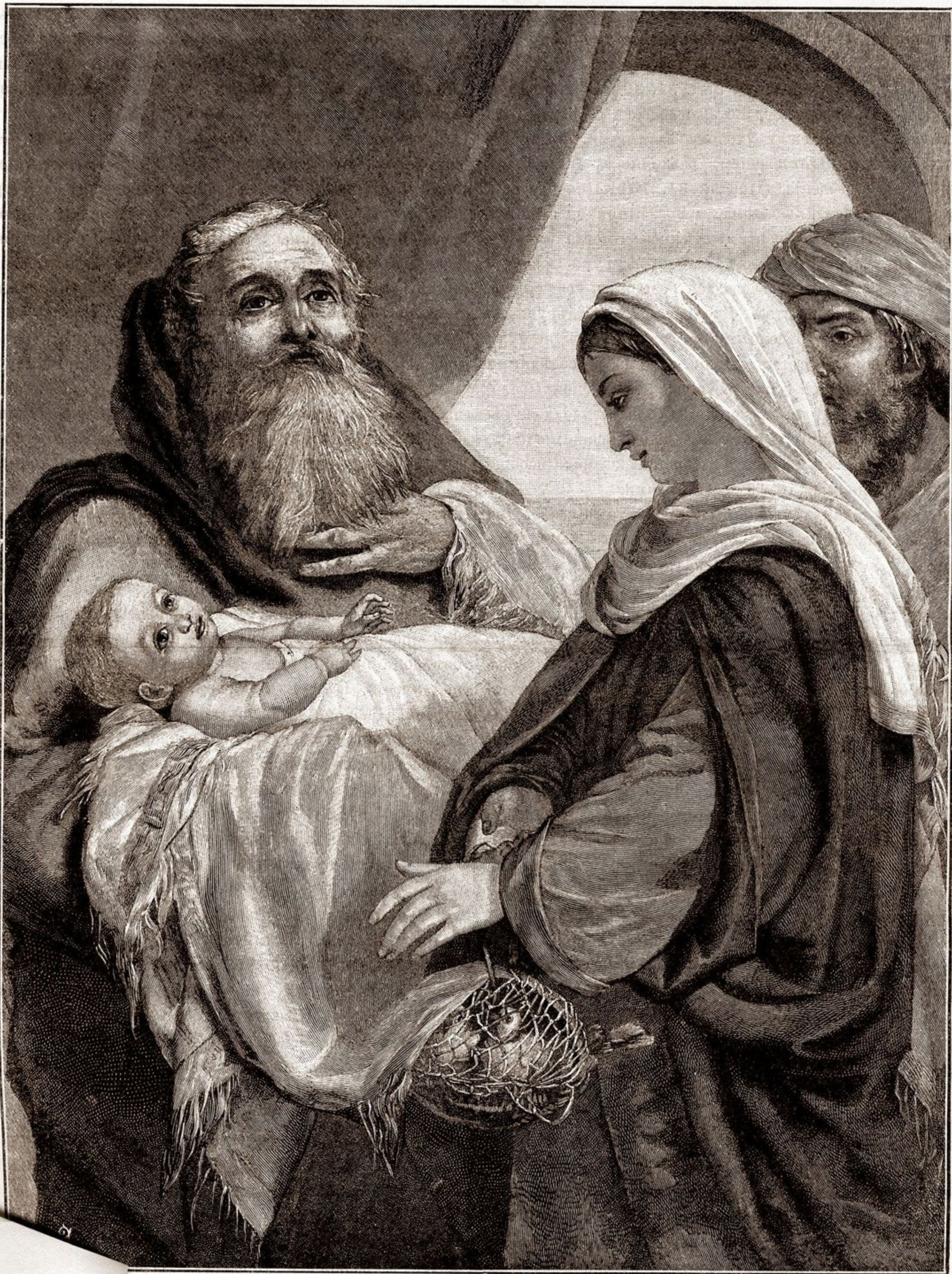
Срѣтеніе Господне. (Съ картины Добсона).