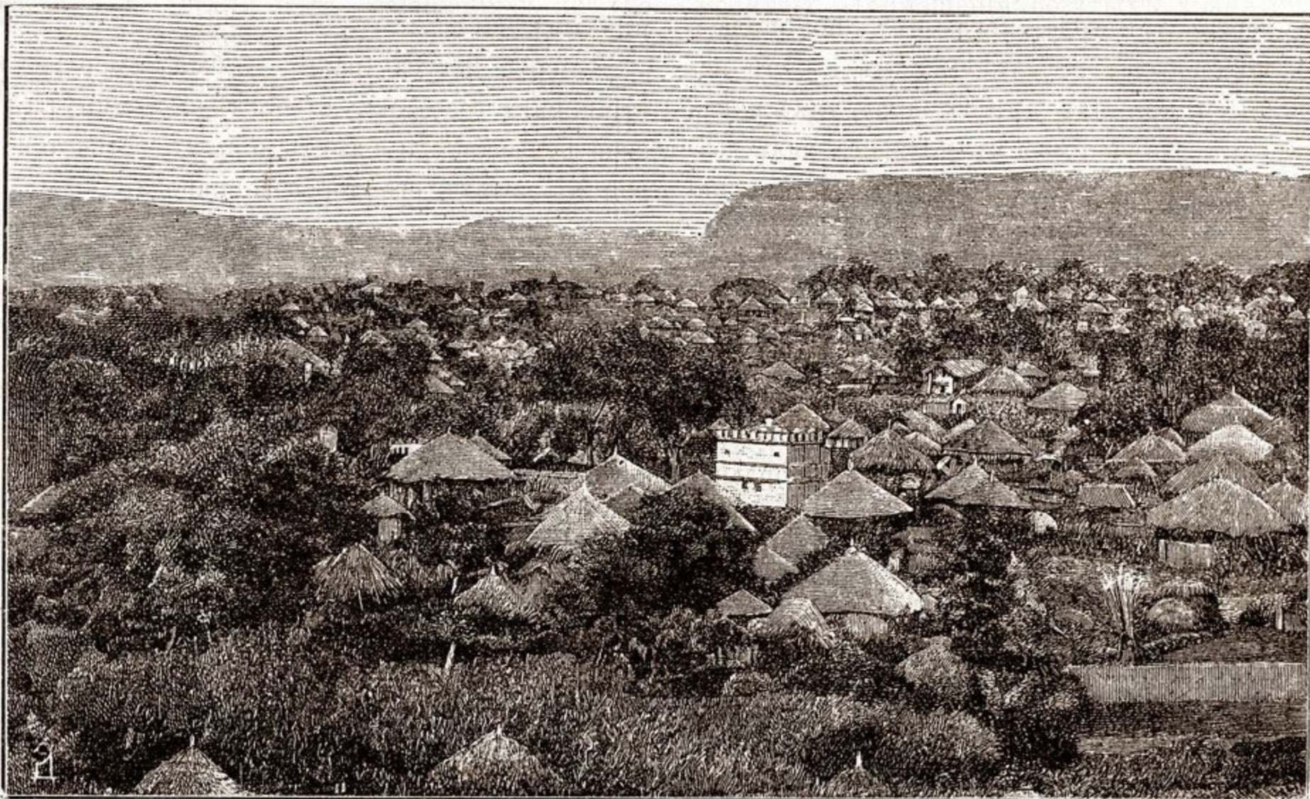
Г о р о д ъ . А к с у м ъ .

все его царство получило названіе Аксумскаго. Съ нимъ прибыло въ страну и множество евреевъ, благодаря которымъ здѣсь, вѣроятно, и утвердилась іудейская религія.