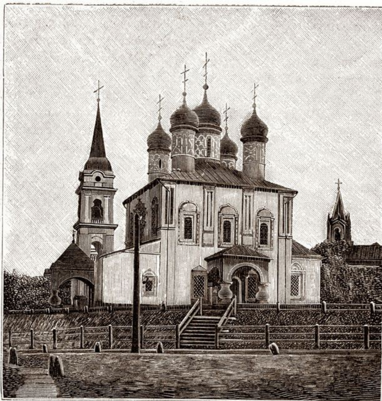
Церковь св. князя Владиміра въ Москвѣ.

Мѣстности, окружающія Китай-городъ, будучи населены новыми жителями, стали называться уже не слободами, а Бѣлымъ городомъ, и тутъ-то на мѣстѣ бывшей Владимірской слободы, у княжескихъ садовъ, и построилъ великій князь Василій Ивановичъ каменную цер-