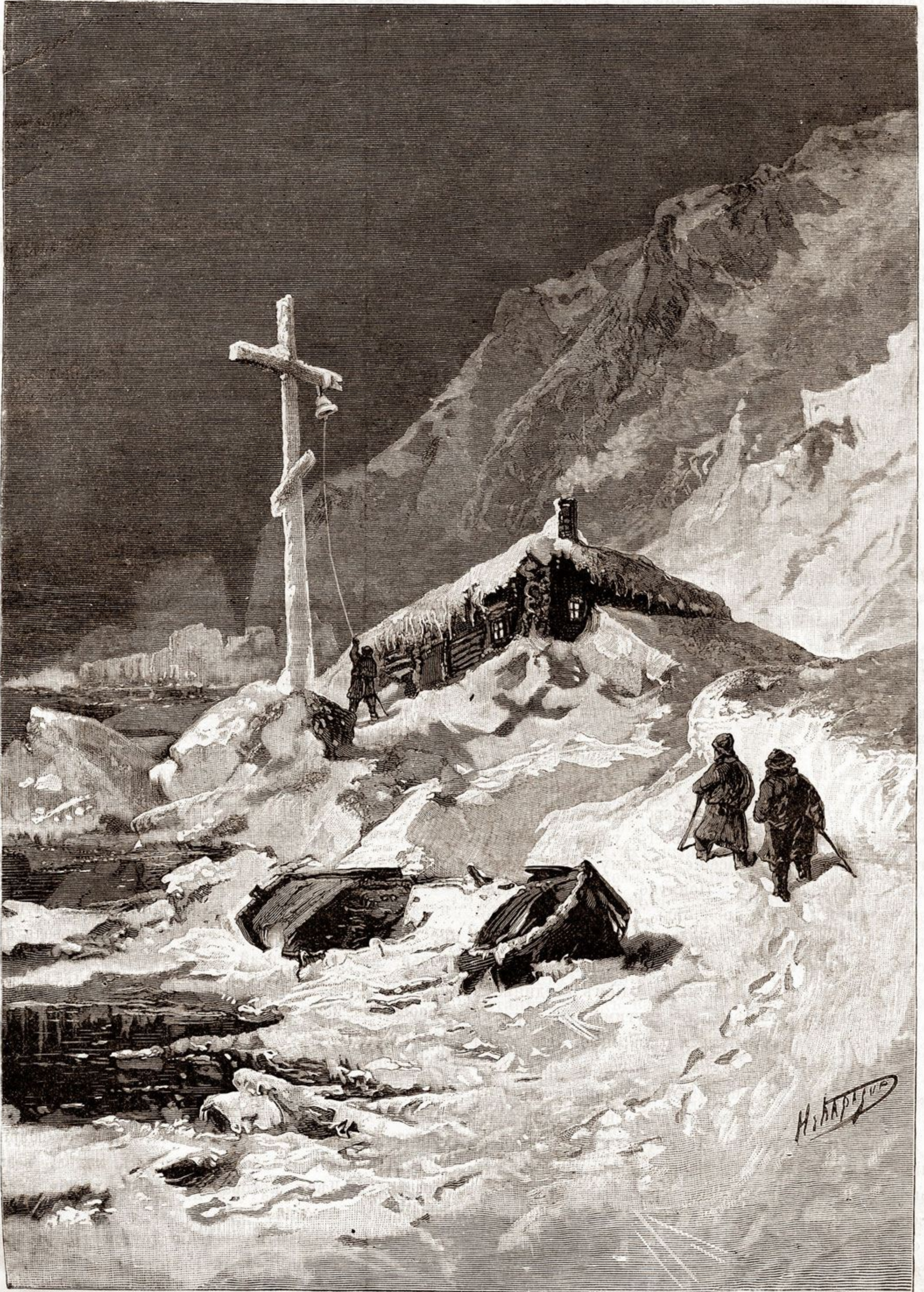
Праздникъ Рождества на крайнемъ сѣверѣ.