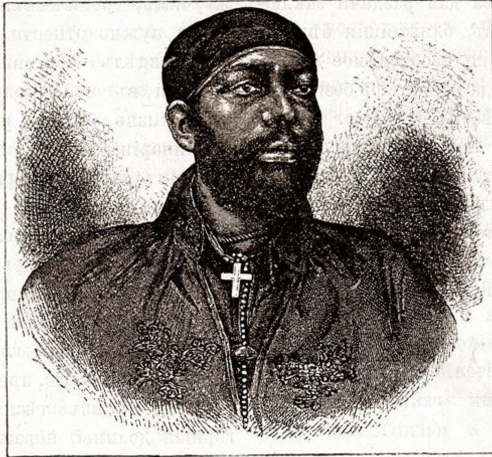
Негусъ Менеликъ II.

зданія города. На улицахъ и площадяхъ валяются разныя мраморныя доски и камни съ вырѣзанными на нихъ надписями, представляющіе обильное и непечатое поле для археологій. Есть также и катакомбы, которыя тоже никѣмъ