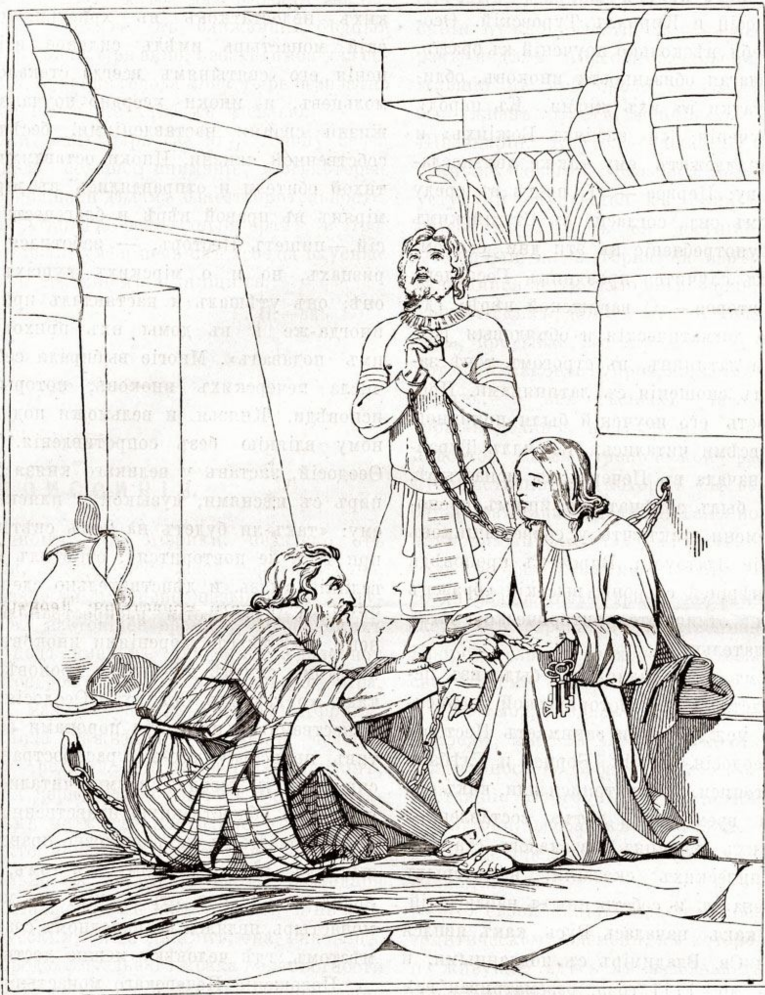
Иосифъ изъясняетъ сны царедворцамъ.

въ до-монгольскій періодъ стояло на Руси не на особенно высокомъ уровнѣ. И вотъ, недостатокъ его восполнялся въ нѣкоторой мѣрѣ монастырями и въ особенности Печерскимъ. Студійскимъ уставомъ, положеннымъ въ немъ въ основу монастырской жизни, предписывалось инокамъ заниматься книжнымъ дѣломъ, и уже при преп. Θεодосіѣ въ монастырѣ является кружокъ любителей просвѣщенія, во главѣ котораго стоитъ самъ преподобный игуменъ его. Эти любители какъ сами занимались