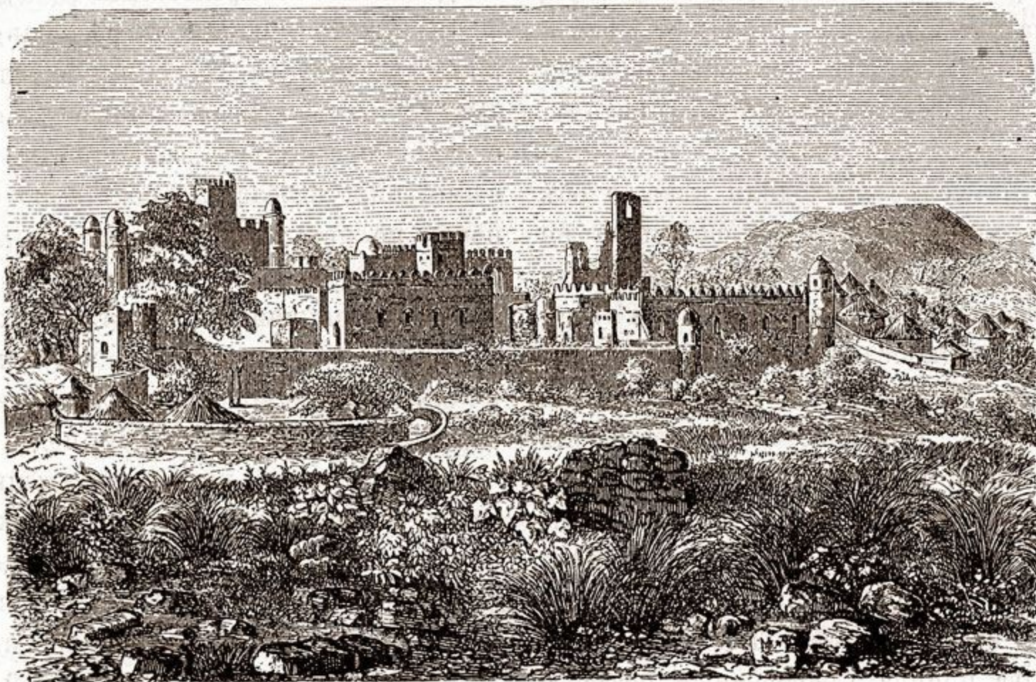
Дворецъ негусовъ въ Гондарѣ.

зданія города. На улицахъ и площадяхъ валяются разныя мраморныя доски и камни съ вырѣзанными на нихъ надписями, представляющіе обильное и непечатое поле для археологій. Есть также и катакомбы, которыя тоже никѣмъ